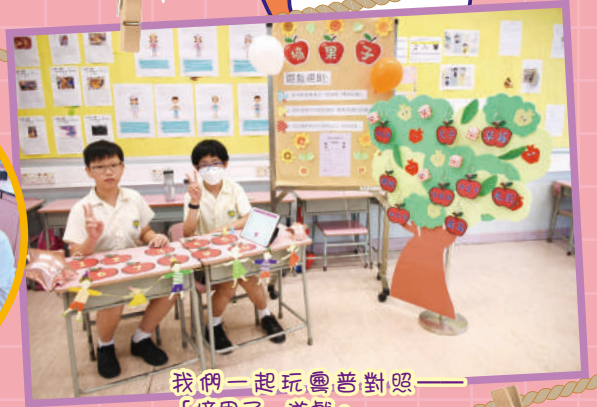
我們一起玩奧普對照——「摘果子」遊戲。