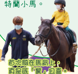
首次騎在馬背上，真是既「驚」且喜。