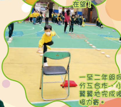
一至二年級同學分工合作，小心翼翼地完成磚礮接力賽。