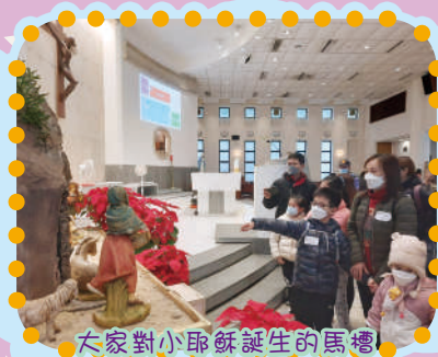
大家對小耶穌誕生的馬槽都感到很好奇呢！

12月17日是「親子朝聖日」，家長及師生前往柴灣海星堂。校長透過誦讀聖言、福音分享，帶領大家一起認識耶穌誕生的故事，大家樂在其中。