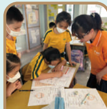
導師指導同學規劃「理財大計」。