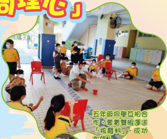
五年級同學互相合作，蒙着雙眼運送「核廢料」，成功在望！！

以五年級的歷奇活動「運送核廢料」為例，有一半同學需要蒙着雙眼運送物資，他們身邊則有一位「開眼」的同學，負責給予提示，蒙眼者有一段長時間看不到周圍的東西，很依靠同伴的提示，吸收外間的信息。希望大家能夠從有意義的歷奇活動中，學會站在對方的角度思考問題，以及運用同理心，理解對方的需要！