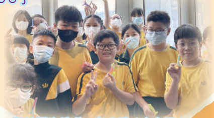
與壯麗的維港，來個開心大合照！

五至六年級同學在6月13日前往「天際100」，參觀多元化的展覽設施，探索香港城市蛻變及發展歷程。