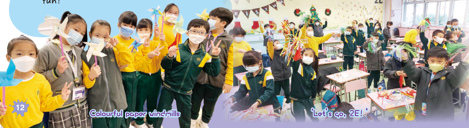
Colourful paper windmills