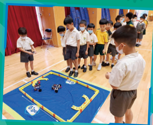
Gigo機械人足球比賽，鬥智鬥力。