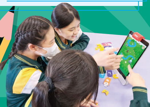
學生能學習基礎編程，提高團隊合作和邏輯思維能力。