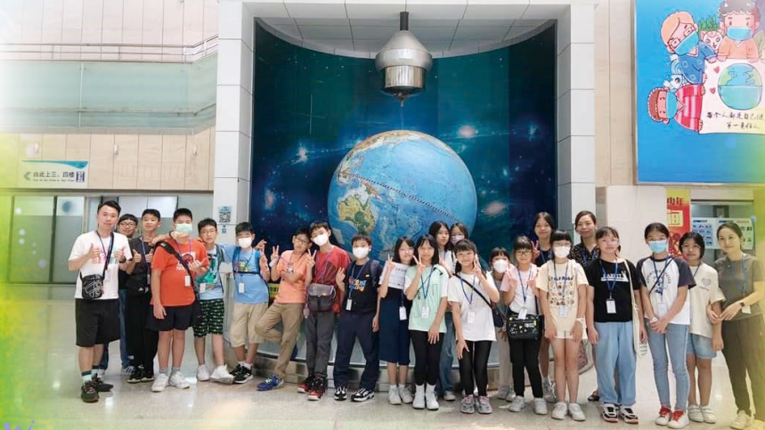
領隊老師和同學一起在惠州科技館前大合照。