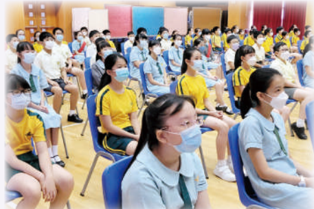
風紀們正襟危坐，緊記當領袖生的每項要訣。