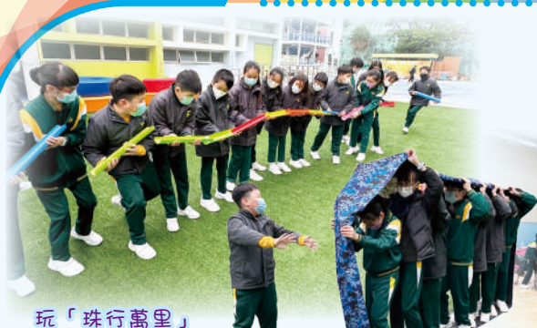
玩「珠行萬里」遊戲，同學們小心翼翼，傳球至終點。

在1月17日，為提升風紀隊員的團隊及與人合作的精神，以及訓練隊員的領導能力，學校安排了六年級的風紀隊員參加了於八鄉少訊中心舉行的「領袖生歷奇訓練日營」。