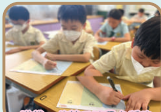
賺錢、儲蓄和消費之間的主要分別是什麼……