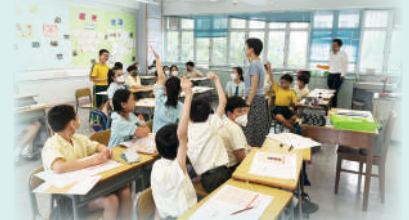
同學發表自己對金錢的看法。

在7月5及6日，五年級同學到訪海洋公園進行專業團隊訪談、工作場地考察，藉以認識海洋公園內多元化的工作機會。