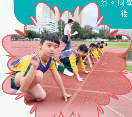
起跑線上，健兒們整裝待發。