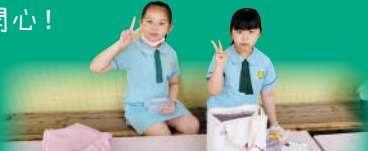
同學們都愛在小息時邊吃小食邊談天。

恢復全日制上學，同學們在學校參與課外活動的時間更充裕。一切復常，學校生活更多姿多采了！有的同學把握午息時間抄寫家課冊及做功課，笑言要學懂惜時，回家可以多點時間溫習，有的同學跳繩、下棋，有的同學吃水果、談天……好不開心！