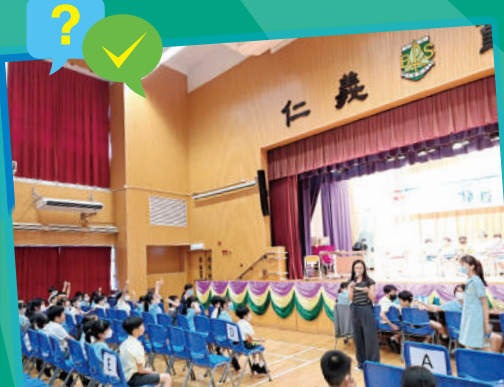
大家都踴躍參與常識問答比賽。