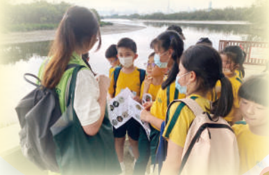
用心聆聽導賞員講解生態知識。

三年級同學於6月14日跟隨常識科老師前往南生圍，觀賞濕地生物，欣賞漂亮的紅樹林及魚塘生態，獲益良多。