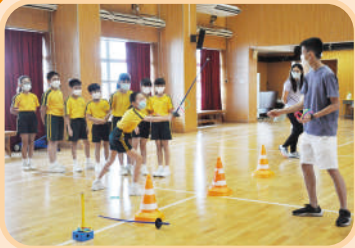
這套動作有點兒似「持棒穿圈」，難不到身手敏捷的同學們。