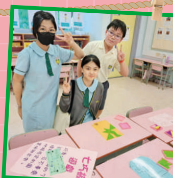
數學攤位的「七巧板」遊戲。