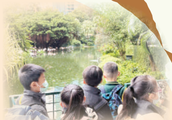
拜訪九龍公園的鯉鸞。

低年級同學參與了「戶外學習日」，結合各科學習目標，在鳥語花香的環境下，享受愉快的學習旅程。