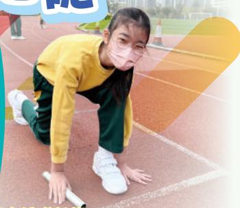
參賽者準備就緒：GET! SET! GO!

2月9日是本校在疫情緩和後復辦運動會的大日子，當天同學們精神抖擻，一、二年級同學進行親子遊戲比賽，三、六年同學進行各項田徑比賽。一眾運動健兒在比賽場上全力以赴，爭取佳績；家長亦難得抽空一起參與，大家都能充分感受到「柏德人」的溫暖。看台上各班同學竭力打氣、吶喊助威，為班內的運動員加油打氣，「班際啦啦隊比賽」，氣氛非常熱烈。同學、家長、老師都十分投入，一起體驗運動的樂趣。最後，運動會在一片歡愉的氣氛中圓滿閉幕。