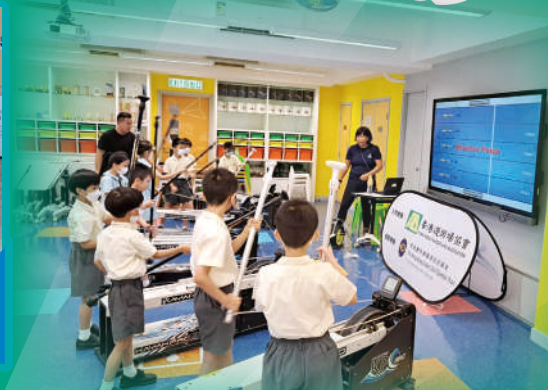
同學三人一組，興奮地進行直立板模擬水上競技活動，看誰划得最快？