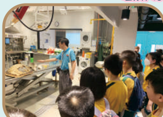
同學初見海洋生物的骨頭，真是大開眼界!