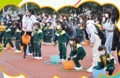
親子合作，加深彼此了解。