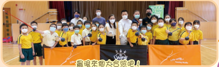
最後來個大合照吧!!

10月18日，香港劍擊學院到本校舉行「劍擊全方位活動」。是次活動旨在培養五年級同學思考及應變力。導師配合技術及戰術訓練，教導同學觀察對手及戰術應用，同時介紹肌肉耐力及協調性練習，讓同學掌握劍擊的基本姿勢、步法、技術，享受了一次輕鬆、有趣的劍擊體驗。