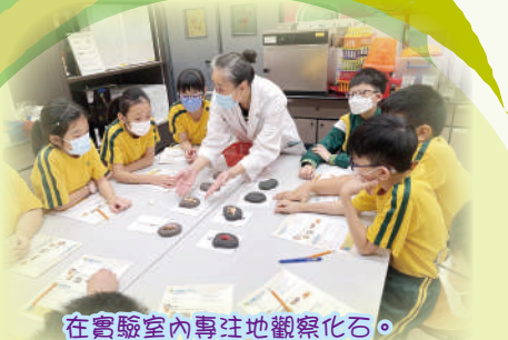
在實驗室內專注地觀察化石。

高年級同學於6月20日參加了科學館舉辦的科學探索活動，藉着趣味的實驗，觀察化石，初步認識遺傳學的基本知識，大家都感到很好奇呢！