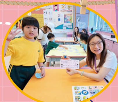
在中文科攤位獲得印花，真開心!