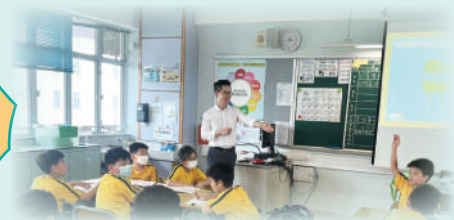
同學與「賺錢大師」交朋友!

在課堂中，學生可以了解到金錢在日常生活中的作用和重要性，明白到賺錢、儲蓄和消費之間的主要分別，學懂辨別「需要」與「想要」。