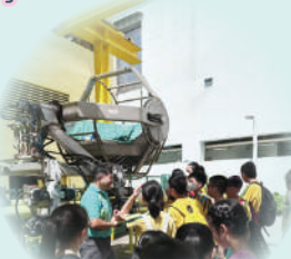
這個是鳥籠嗎?其實這台是用以維修過山車的工程車!