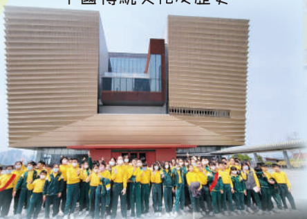
同學於香港故宮博物館前合照。