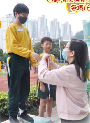
能站在領獎台上，實力非凡!