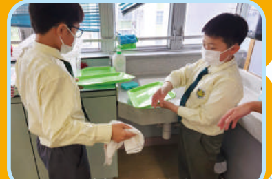
同學們很快熟習收拾飯盤的過程。

恢復全日制上學，同學們在學校參與課外活動的時間更充裕。一切復常，學校生活更多姿多采了！有的同學把握午息時間抄寫家課冊及做功課，笑言要學懂惜時，回家可以多點時間溫習，有的同學跳繩、下棋，有的同學吃水果、談天……好不開心！