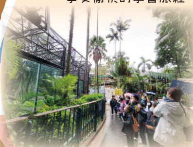
跟可愛的暹羅洲猩猩打招呼。