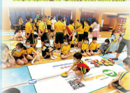
3C班石相言同學：「看吧！我發的球將會最接近中心點！」