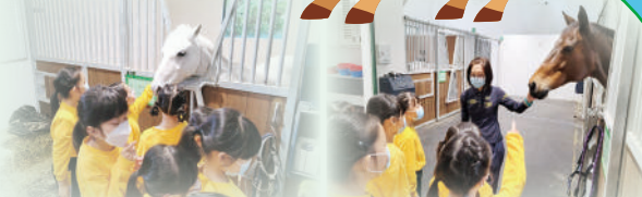
與雪特蘭小馬初接觸。

是次參觀活動旨在教育學生對馬術的認識，讓學生跳出傳統學習環境，接觸馬術，從而引起對馬術運動的興趣。當日活動內容包括：觀賞《認識馬術》影片、學習馬術的基本知識及安全注意事項、參觀馬廄、騎術課堂觀課、策騎小馬及餵飼雪特蘭小馬。