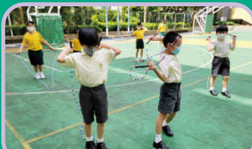
忙裏偷閒，趁着小息跟同學比試跳繩技倆。