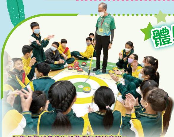
同學們聚精會神地聆聽導師講解賽規。