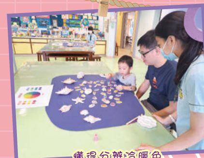
懂得分辨冷暖色的小魚兒嗎?