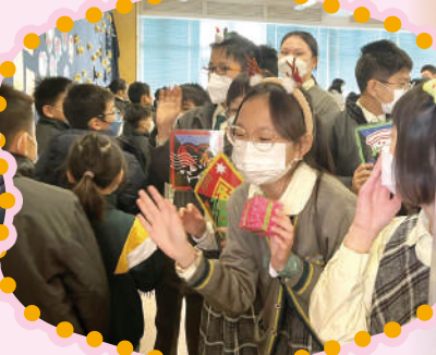
我們在聖誕巡遊互祝平安。