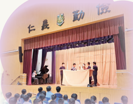
「當耶穌擘餅時，門徒的眼開了，認出耶穌來。」

臨近復活節，我校榮幸邀請了彩虹邨天主教英文中學師生到訪，進行天主教福傳表演，透過互動話劇、雜耍及歌舞表演，讓同學感受到耶穌復活的喜樂。