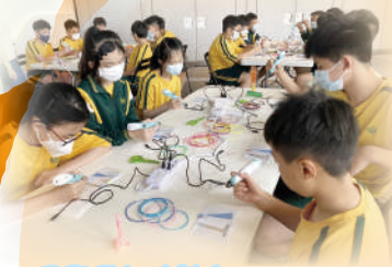
同學投入地製作「天際100」3D模型。

為了讓學生走出課室，豐富學習經驗，本校安排了豐富的戶外學習體驗，結合各科的學習目標，學生能探索課室以外的全方位知識，引發了他們無限的好奇心及探究能力。