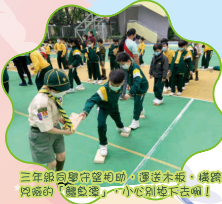
三年級同學守望相助，運送木板，橫跨凶險的「鱷魚潭」，小心別掉下去喇！