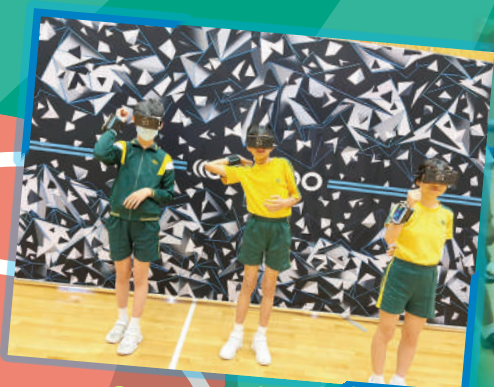
「HADO」閃避球，考驗同學的溝通及合作能力。