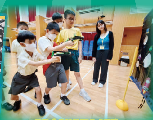
握緊「噴射氣壓機械手臂」，瞄準九宮格，發射！