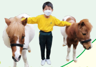
與小馬合照，留下美好回憶。