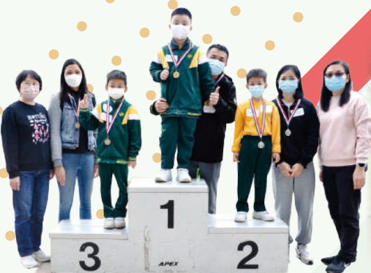
優勝家長及其子女領獎。