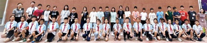
惠州仲愷高新區第六小學精心為我校交流同學預備了「趣味運動會」。兩校同學透過有益身心的競技活動、集體遊戲和籃球對賽等，互相認識。