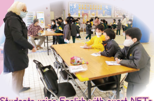
Students using English with guest NETs.