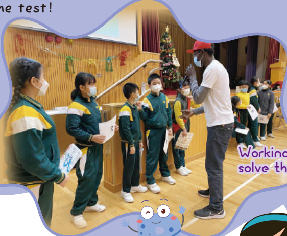
Working in teams to solve the problem.

In the School Hall, P.5 and P.6 students played language mass games through stories. Listening skills and speaking skills were put to the test!