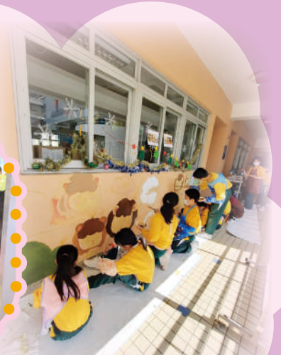
同學認真地畫宗教壁畫。