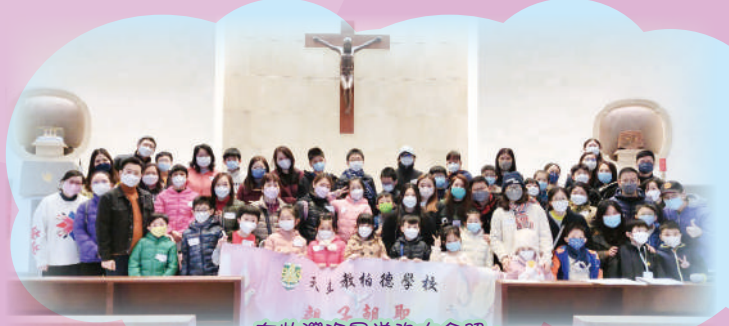
在柴灣海星堂的大合照。

為培育同學認識天主教的核心價值，本校宗教及倫理科全年舉辦了不少宗教活動，讓同學親親主耶穌，沐浴在主恩。