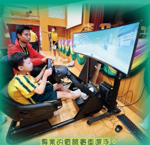
專業的電競賽車選手，展示驚人的駕駛技術。

資訊科技及電腦科的老師亦安排了學生在STEM DAY使用OSMO及程式編碼積木，控制虛擬角色，解鎖虛擬世界的地圖內各種難題，在遊戲中尋找物品和建造房屋。