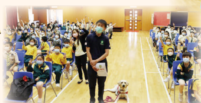
義工們跟同學玩搶答遊戲。