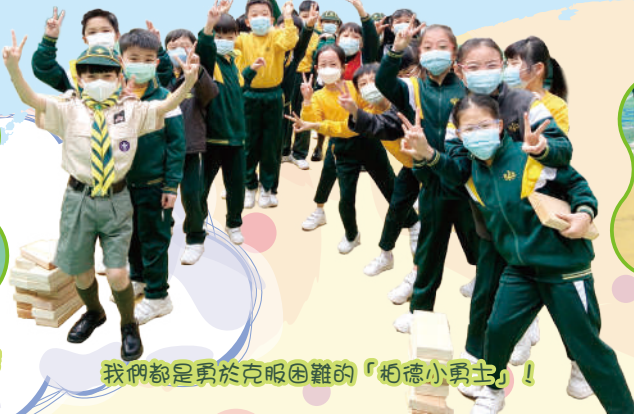
我們都是勇於克服困難的「拒毒小勇士」！