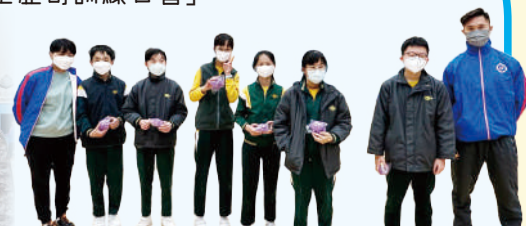
「八鄉攻礮戰」遊戲的優勝隊伍。