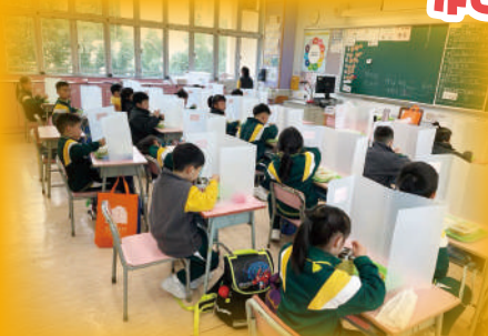
三年級以下的同學首次與同學共進午餐。