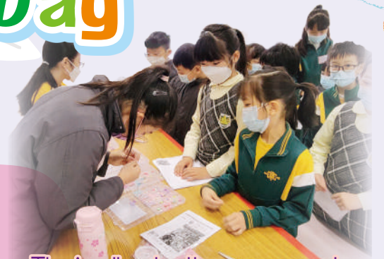
The jewellery booth was very popular.

In the covered playground, NETs and special helpers from P.4 and P.5 operated ten different game booths. A particular favourite among all students was the booth where students were able to make a piece of jewellery. Other booths involved re-telling a story, identifying which character was being described and playing a miming game.