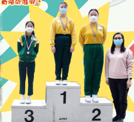
優勝者領獎，真威風!