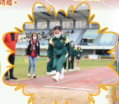
你看他身手多矯健!