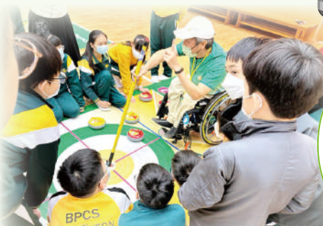
導師為同學介紹地壺球的用具：推桿、地壺球及地墊。