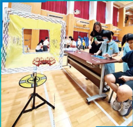
操控電動無人飛行機，飛越障礙物，真刺激！