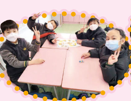
大家都很享受下宗教棋呢！