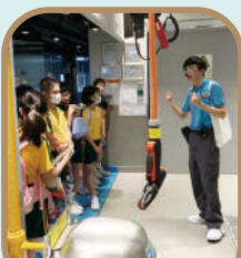
導遊員帶領同學到水族館參觀大型設備。

在7月5及6日，五年級同學到訪海洋公園進行專業團隊訪談、工作場地考察，藉以認識海洋公園內多元化的工作機會。