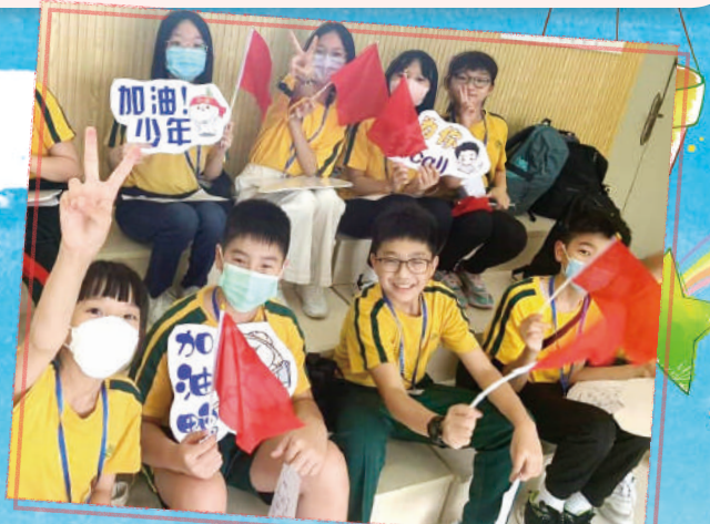
同學在老師的安排下，一起同唱《我和我的祖國》。