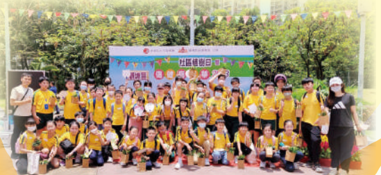
老師和同學於公園留影。

5月20日，同學參加了「觀塘社區植樹日暨傷健嘉年華」，攜手綠化社區，學習「傷健共融」的正向價值觀。