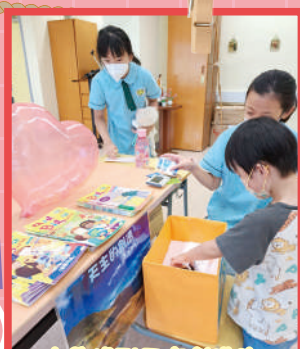
你能找到天主創造的事物嗎?