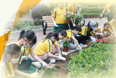
合力把花苗移植到園圃內。

5月20日，同學參加了「觀塘社區植樹日暨傷健嘉年華」，攜手綠化社區，學習「傷健共融」的正向價值觀。