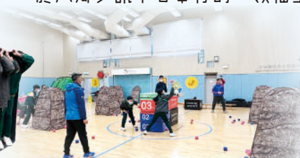
隊員投入「八鄉攻礮戰」之中。