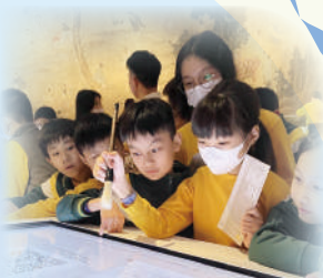
我是小小書法家，看我大筆一揮！

五年級同學於3月16日參觀故宮博物館，進行「穿越故宮之旅」，透過有趣的展覽及互動體驗設施，認識中國傳統文化及歷史。