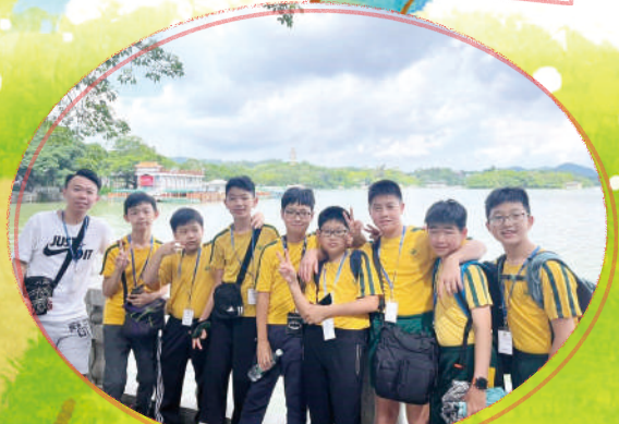
漫步山明水秀的惠州西湖，欣賞湖光山色，一樂也。