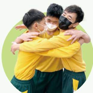
6E班同學在接力賽項目奪得冠軍，隊員相擁祝賀!