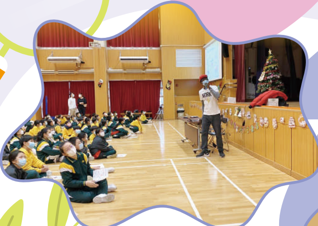
Listening to the story.

In the School Hall, P.5 and P.6 students played language mass games through stories. Listening skills and speaking skills were put to the test!