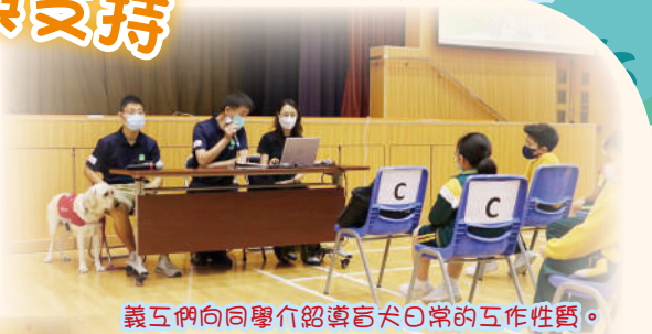
義工們向同學介紹導盲犬日常的工作性質。

本校於 11 月 26 日邀請香港導盲犬服務中心 (HKSEDS) 的義工們到校與小四同學分享視障人士與導盲犬合作的經歷。同學們透過嘉賓的經驗分享與互動體驗活動，了解到視障人士日常遇到的挑戰以及導盲犬的偉大使命。相信同學日後在任何地方遇到失明人士以及導盲犬時，也會記得怎樣和他們相處，讓大家一同建設一個多元共融的社會。