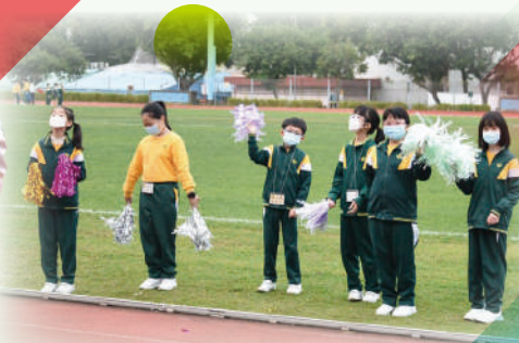
啦啦隊在賽道為參賽者打氣。