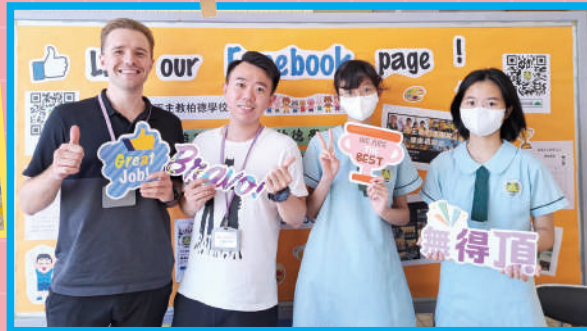
Welcome To BPCS!