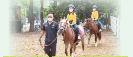
策騎時，雖有左搖右晃、欲搖欲墜的感覺，但同學們還是覺得歡樂勝於惶恐。