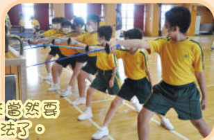
接下來當然要練習步法了。