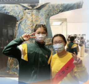
多美麗的宮廷服飾啊！

低年級同學參與了「戶外學習日」，結合各科學習目標，在鳥語花香的環境下，享受愉快的學習旅程。