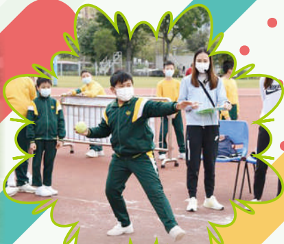
看他擲壘球時有板有眼，功架十足!