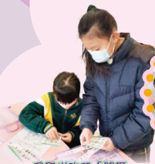
同學研讀和「關愛」有關的聖經金句。

「宗教日」於12月19日舉行，透過宗教創作、看電影、「金句達人」、宗教棋等遊戲，帶出校本價值主題——「關愛」及「同理心」的信息。部分高年級同學參與了聖經故事壁畫活動，提升學校宗教氛圍，美化校園。