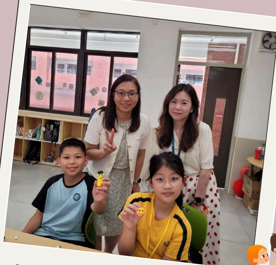
與佛山學生齊上體驗課