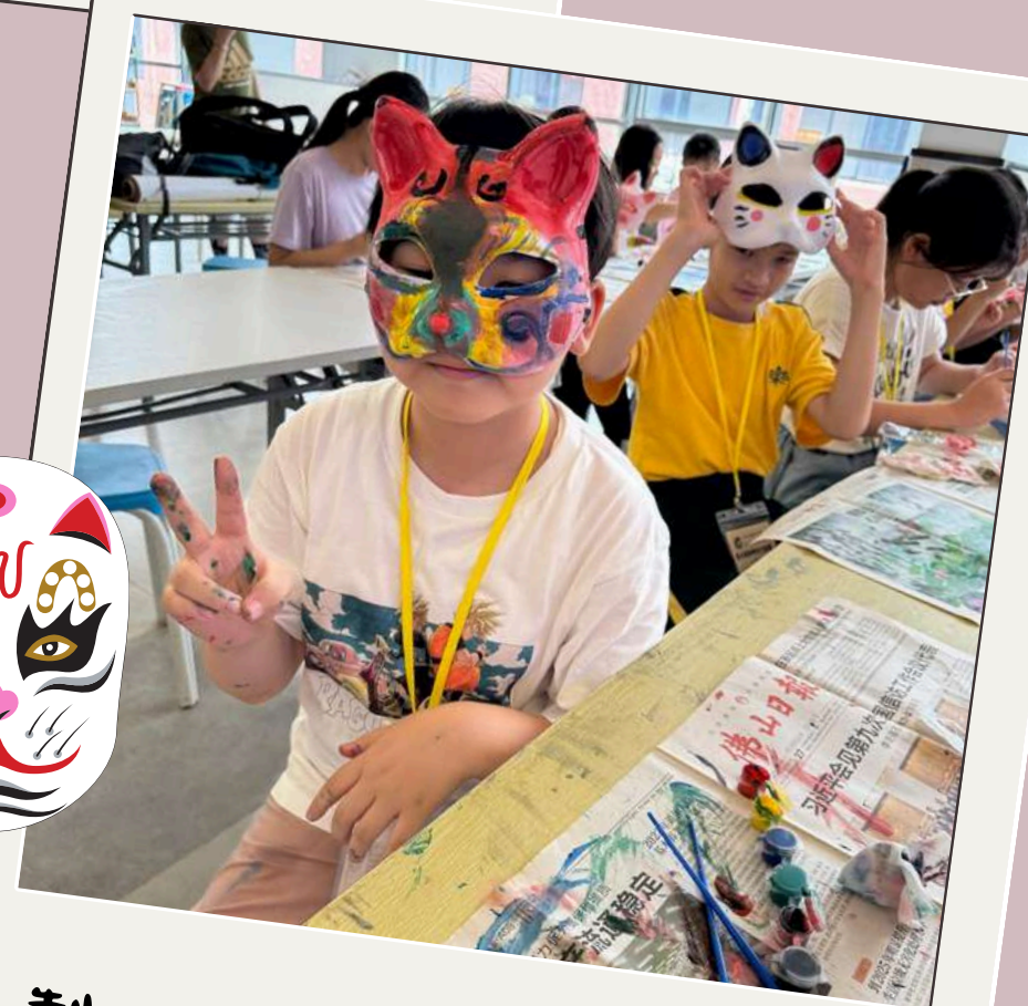
製作臉譜DIY，盡顯創意