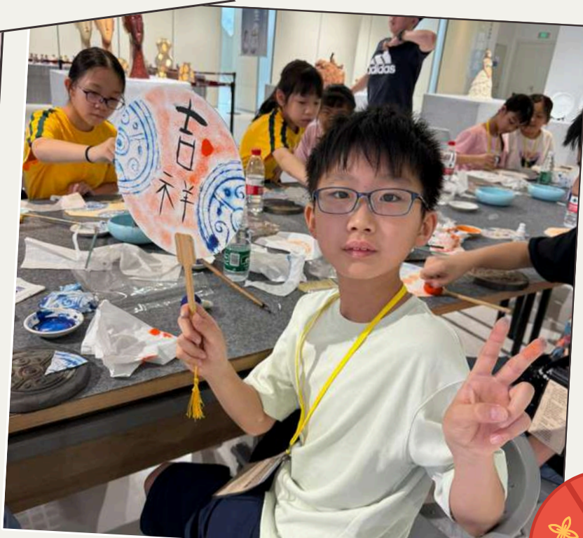
製作「瓦當拓印團扇」， 體驗非遺文化