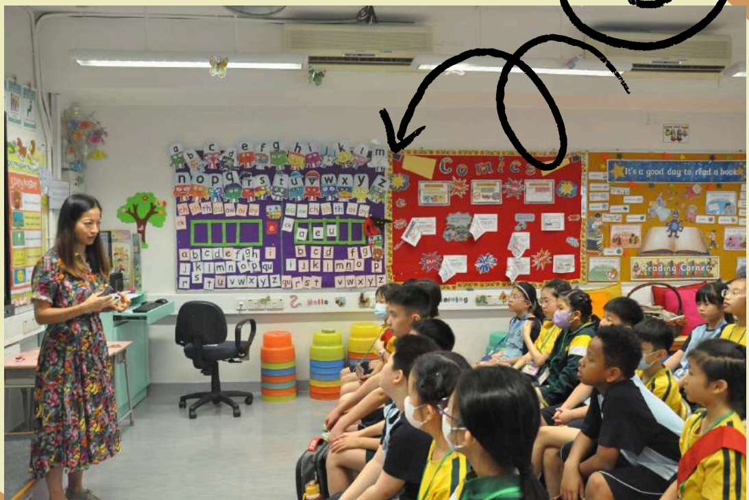
輕輕鬆鬆上英文體驗課