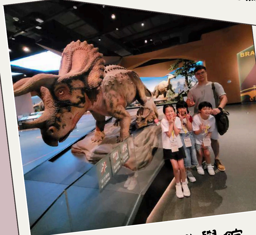
參觀順德自然科學館， 親親恐龍

第一天 - 本校師生到佛山暨大港澳子弟學校進行探訪交流活動，期間學生與姊妹學校學生進行中、英、音、戲劇、STEM體驗課，並進行升旗禮交流及競技比賽。 第二天 - 學生到佛山祖廟觀看舞獅表演及製作臉譜DIY。 第三天 - 學生參觀順德自然科學館，了解各種古老生物及恐龍的生活習性，並學習製作「瓦當拓印團扇」，獲益良多。