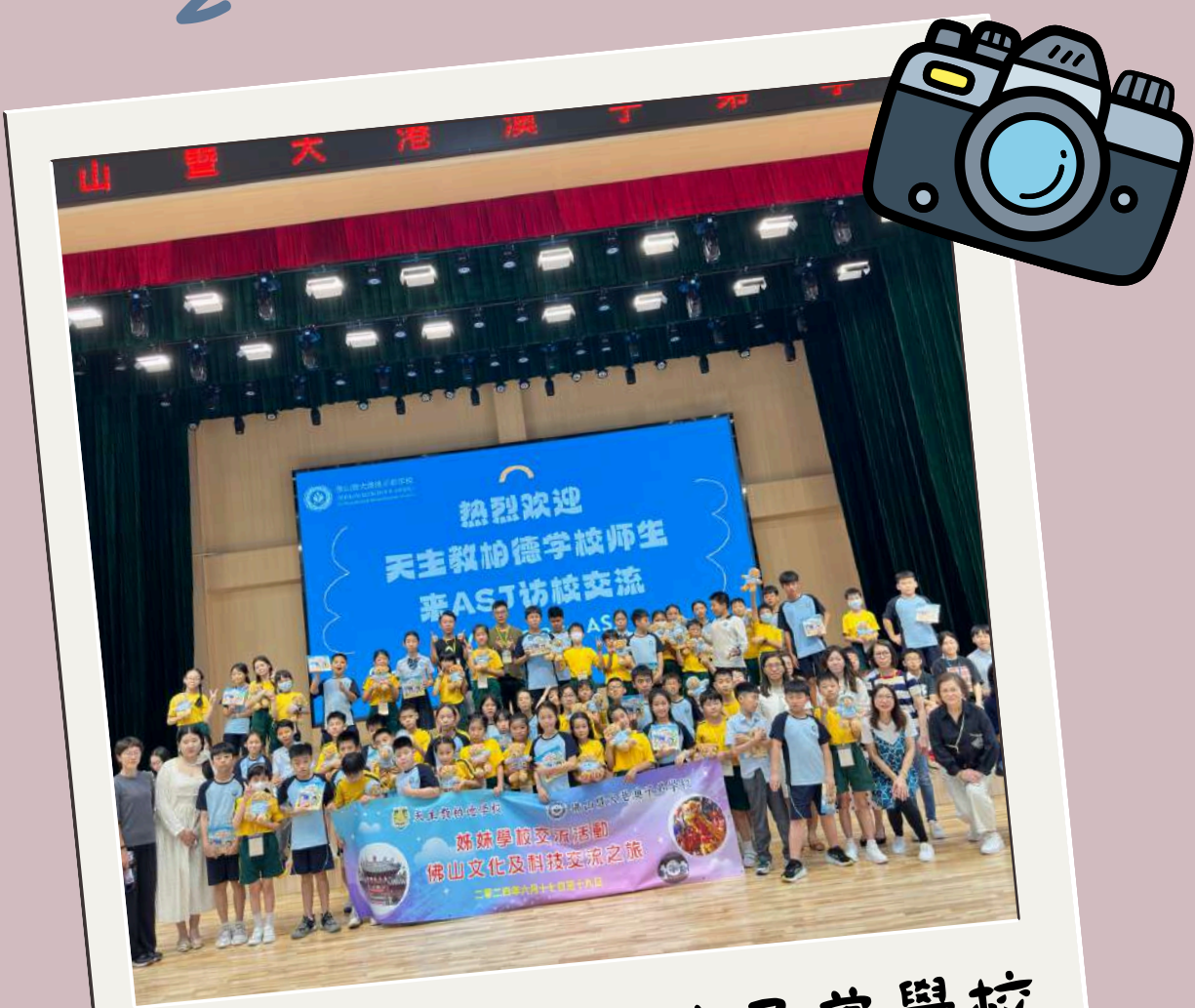
到訪佛山暨大港澳子弟學校， 來張大合照