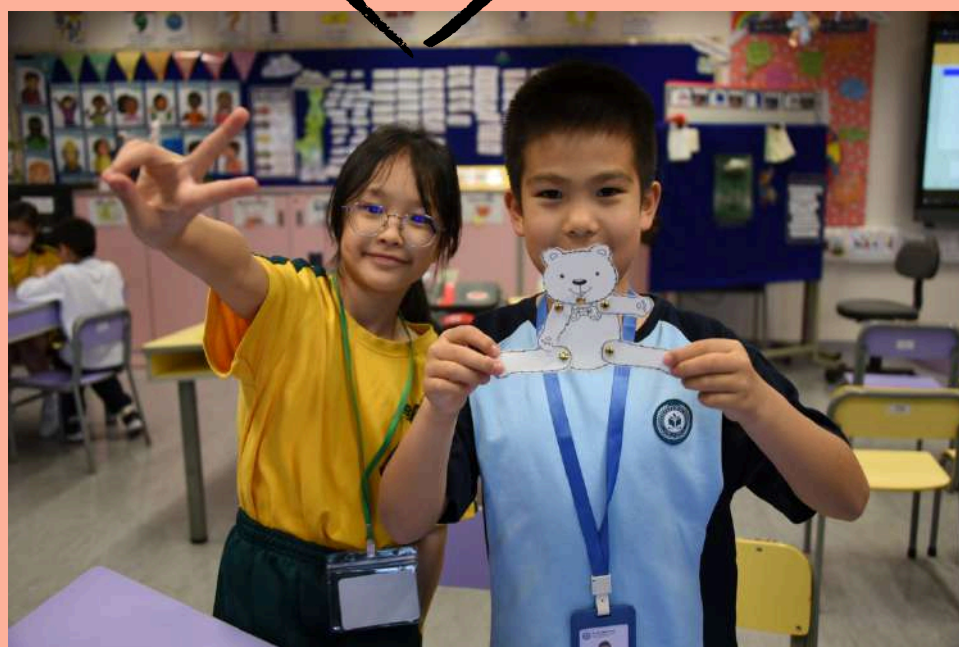
我們的「活動小熊」真可愛!