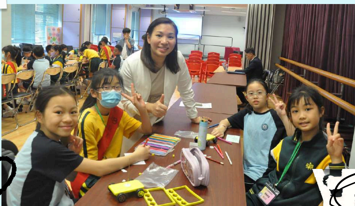
誰的風力車走得快?