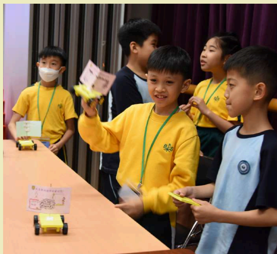
同心協力製作風力車