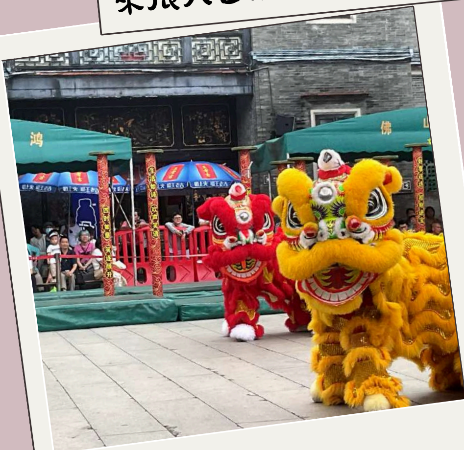
齊來欣賞舞獅表演